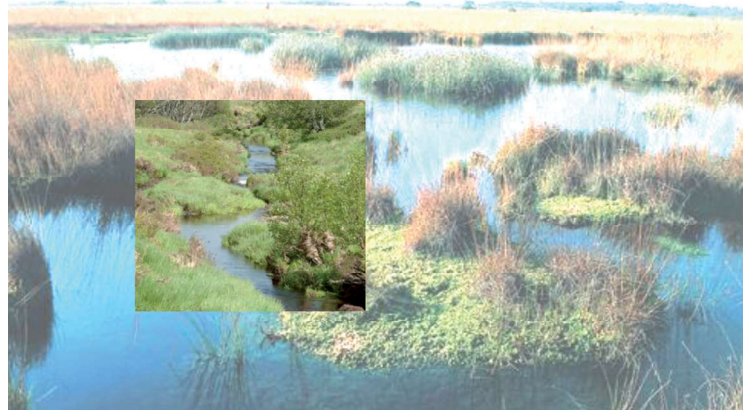
Er ontstaan veenriviertjes

Op de bodem van het moeras kwamen oude resten van afgestorven planten te liggen. Die konden in de natte en zuurstofarme omstandigheden van het moeras niet verteren en vormden een steeds dikkere laag. Die laag van onverteerde plantenresten wordt veen. Het veen raakte regelmatig overstromd door zee en rivierwater, waardoor slib (klei- en zandresten) werd afgezet waar weer planten op konden groeien.