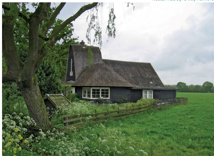
Houten huis bij Fort bij Tienhoven