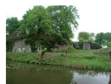
Fort bij Tienhoven

De linie heeft een lengte van 85 km en een breedte van 3 km. De Loosdrechtse Plassen en het fort in het Tienhovens Kanaal langs de Nieuweweg zijn deel van de linie. Kwetsbare delen van de Linie zoals sluizen werden onder schot gehouden vanuit de forten. Het fort met haar gracht in het Tienhovens kanaal is er een van. Het is tussen 1848-1850 gebouwd. Rondom de forten waren zones ('kringen') met een straal van een paar honderd meter vastgelegd. In de eerste zone mocht niets worden gebouwd, de volgende moest vrijgemaakt kunnen worden zodra een oprukkende vijand werd vermoed. Daar mochten alleen houten - snel te verwijderen - huizen gebouwd worden. Het houten huis met atelier aan de Nieuweweg (nummer 3) is daar een voorbeeld van. Aan de Linie is lang doorgebouwd. Tussen 1914 en 1940 zijn verspreid tussen de forten ook nog