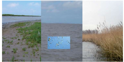
Achter de zandbanken ontstaat veen

tweeduizend jaar lag er een vrijwel gesloten stelsel van lage duinen op de zandbanken. Het gebied tussen de zandbanken en de droge hoge oostelijke regio's overstromde regelmatig en er vloeide veel regenwater en