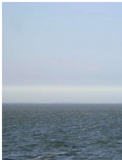
Het natte westen